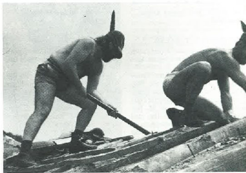
Alpini sui tetti del Friuli martoriato, uniti e solidali nello spirito della ricostruzione.

Insegnamenti prestigiosi, che lasceranno un segno profondo, per sempre, nelle nostre esperienze migliori di uomini e di Alpini, lezioni di umanità che valgono mille volte gli sproloqui di dottrine incomprensibili. «Mandi fradi». Quante volte abbiamo recepito questo saluto, autentico messaggio di fratellanza! "Mandi", che significa, rimani con noi Signore! Rimanete con noi Alpini, voi che avete condiviso le nostre pene ed i nostri dolori, voi che avete mischiato il vostro sudore al nostro ed il vostro sangue alle nostre mura riedificate. Sembra forse un'invocazione ad infondere coraggio, quello stesso coraggio che noi abbiamo però scoperto negli atteggiamenti e nella fede di un popolo che non ha mai conosciuto il benessere materia-