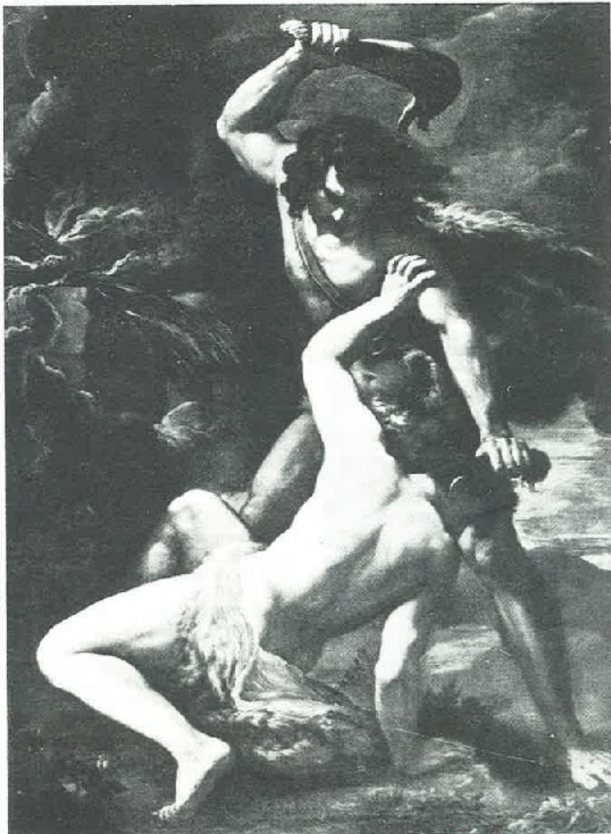
Caino che impersona la vilta dei nostri giorni, si accanisce con violenza su Abele innocente, suggerendo il primo fratricidio della storia del mondo.

Tralasciamo i secoli ed i millenni per giungere d'un balzo ai nostri giorni, per leggere nelle cronache recenti, che hanno ottenuto conferma da fonti diverse, che l'uomo sapiente, ha notevolmente migliorato il suo primato di assassino,