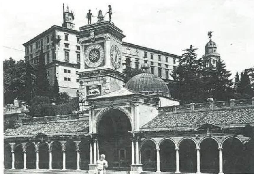
Udine. Il castello, simbolo vivente della città e del Friuli risorto.

logo aperto per l'eternità. «Il Friul us ringrazie di cûr e nol dismentêe». Spetta ora a noi esprimere il nostro grazie sincero ad una città e ad un popolo che possiede una propria spirituale fisionomia, una propria legge che si chiama dovere, un modus vivendi che rispecchia una tradizione millenaria che è stata trapiantata nel mondo, nel luogo dove un solo friulano ha acceso il suo focolare, per essere di esempio degno di imitazione.