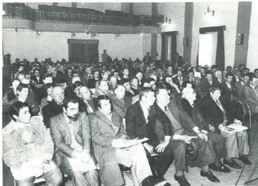
I Delegati all'Assemblea Sezionale.

vivere egualmente. Sono errori gravissimi ed imperdonabili, che possono costare molto cari e che non devono mai più ripetersi.