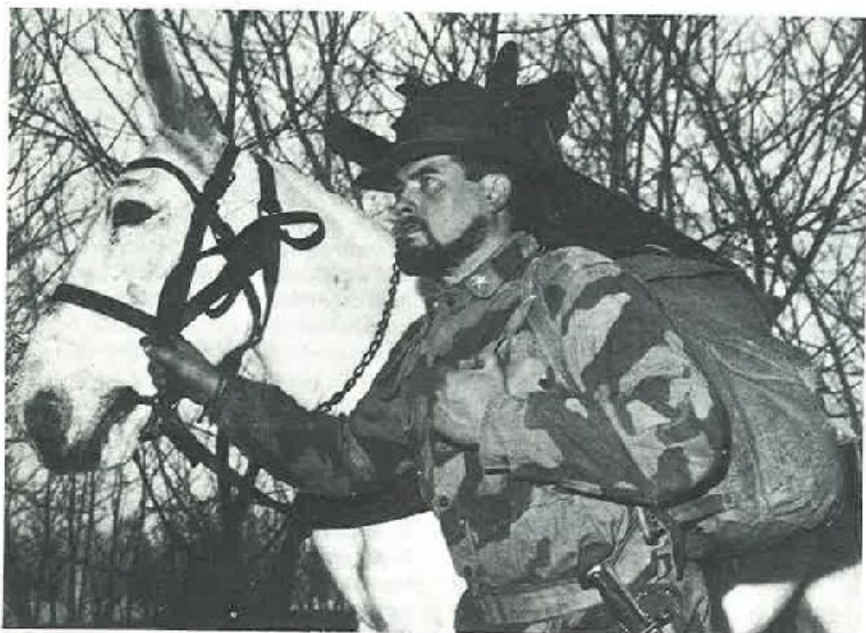
Il mulo, paziente, amoroso ed inseparabile amico dell'Alpino, nei momenti di gioia e di dolore.

La cosa morì là, ma si dice che la sera dello