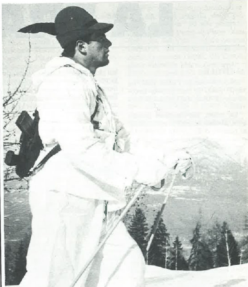
Alpini non si nasce, si diventa, per esserlo per sempre.