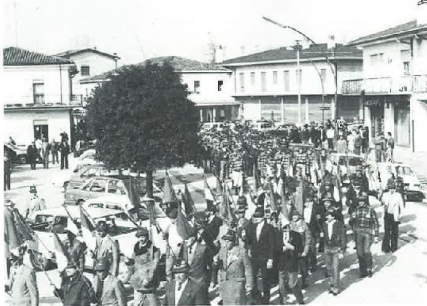
I gagliardetti dei Gruppi della Sezione, sfilano per le vie di Mansuè.

Festa grande domenica 27 marzo a Mansuè, per festeggiare la ricostituzione del Gruppo Alpini.